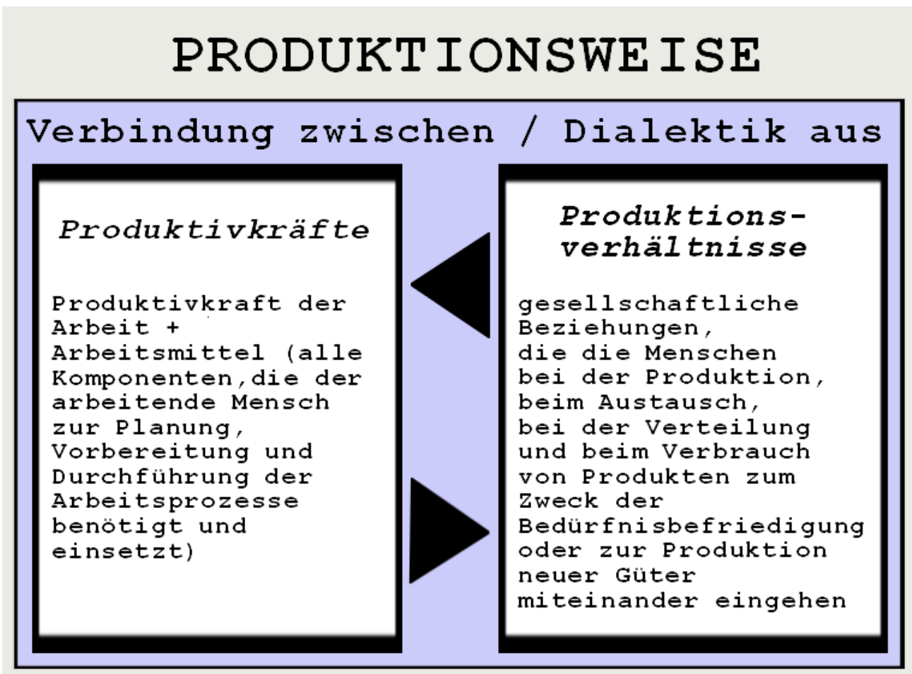
Graphik 6.a): Produktionsweise = Produktionsverhältnisse + Produktivkräfte